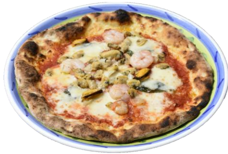
シーフードピッツァ ...1,800yen Seafood pizza