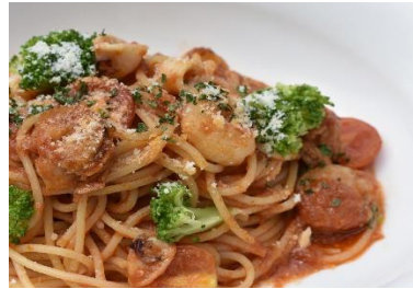
魚介のトマトスパゲティ Tomato spaghetti with seafood