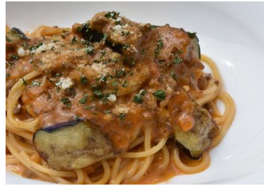
茄子のクリームボロネーゼ eggplant cream bolognese