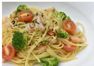
小海老と帆立のペペロンチーノ Shrimp and Scallop Peperoncino