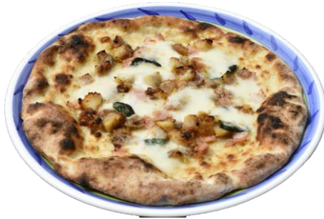
マチュライオ ...1,600yen Machuraio