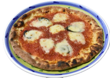
マルゲリータ ...1,200yen Margherita

※全て旬野菜サラダとスープが付いております。 * All come with seasonal vegetable salad and soup.