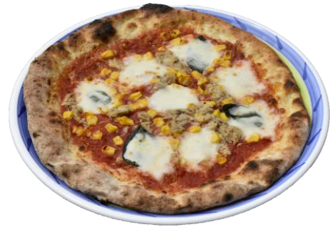
バンビーノ ...1,400yen Bambino