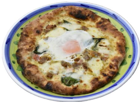
ビルマスク ...1,600yen Bill mask