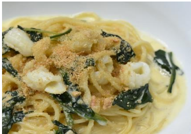
烏賊とホウレン草の明太クリーム Squid and Spinach Mentai Cream