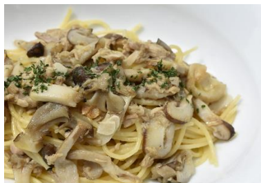
ボスカイオーラ Boscai Aura